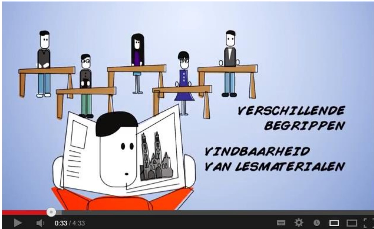
Het Onderwijsbegrippenkader (OBK)